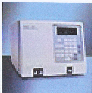
Рис. 1. Фотография внешнего вида кондуктометрического детектора W432.