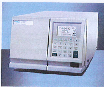
Рис. 1. Фотография внешнего вида абсорбционного детектора W2489