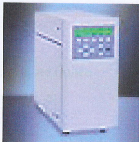
Рис. 1. Фотография внешнего вида электрохимического детектора W2465.