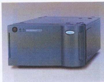
Рис. 1. Фотография внешнего вида абсорбционного детектора W2998.

Обработка результатов анализа может проводиться с помощью интегратора (за исключением детектора W996 и масс-спектрометрического детектора), а также с применением персонального компьютера. В составе программного обеспечения "Миллениум" широкий набор методов обработки и графического представления хроматограмм, методов градуировки и статистической обработки данных.