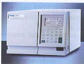
Рис. 1. Фотография внешнего вида флуориметрического детектора W2475.